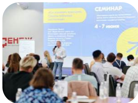
Семинар общественных советов в Сенеже