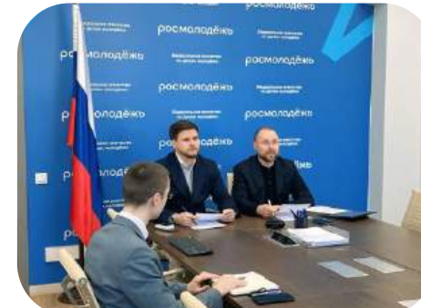
Участие в совещаниях с региональными министрами