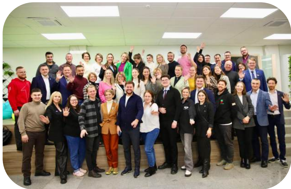
семинар-совещание декабрь '23