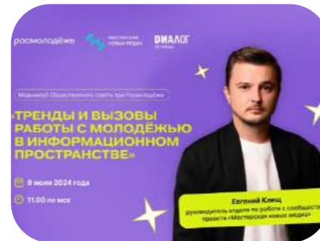
Медиа-клуб для общественных советов